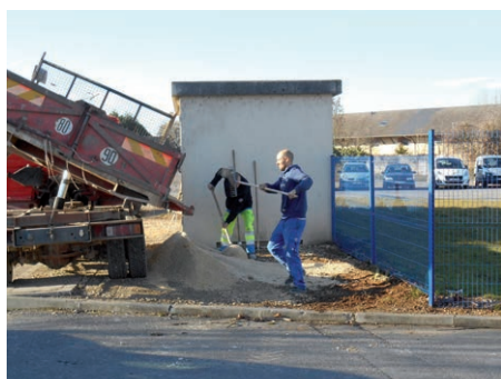
Réfection du trottoir en grave calcaire rue Pasteur