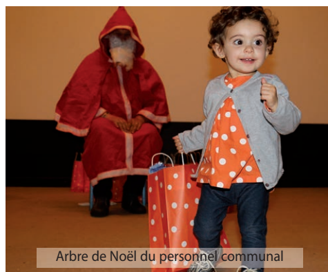
Arbre de Noël du personnel communal