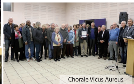
Chorale Vicus Aureus