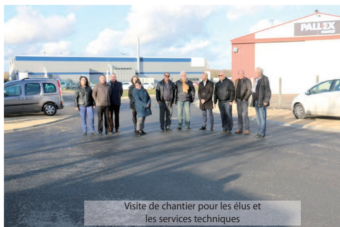
Visite de chantier pour les élus et les services techniques