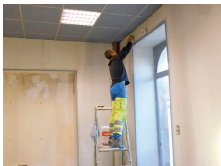
Peinture refaite de l'Accueil Ado salle Dordain