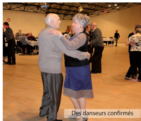
Des danseurs confirmés

Malgré le contexte économique difficile et les choix budgétaires qui doivent être faits, la municipalité tient à conserver ce moment privilégié qu'elle entretient depuis de nombreuses années avec ces aînés.