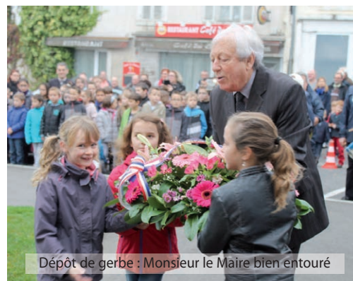
Dépôt de gerbe : Monsieur le Maire bien entouré

Les enfants, nombreux ce jour là, poursuivront à leur tour ces cérémonies importantes.