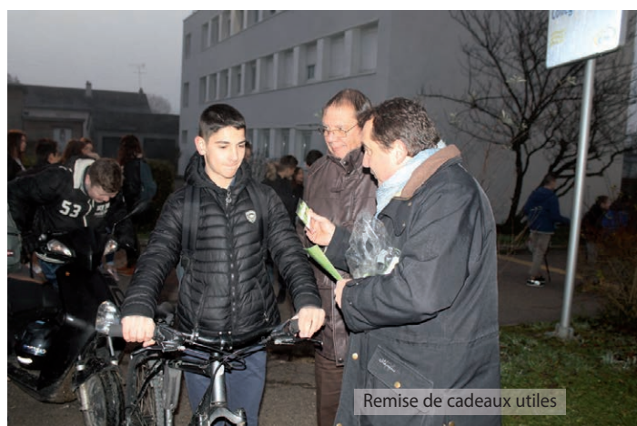
Remise de cadeaux utiles

Appelée " À vélo, voir et être vu, c'est vital ", cette opération s'est déroulée dans la plus grande simplicité, les deux intervenants regardant juste si les cyclistes disposaient des moyens d'éclairage et distribuaient par la même occasion de petits présents très utiles, comme des lampes ou des brassard réfléchissants.