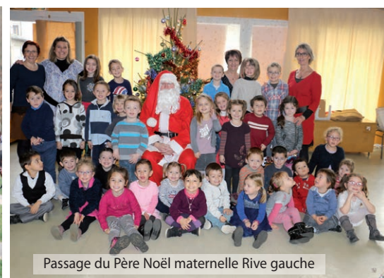
Passage du Père Noël maternelle Rive gauche