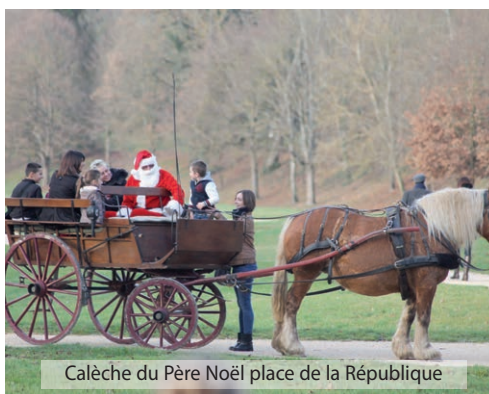
Calèche du Père Noël place de la République