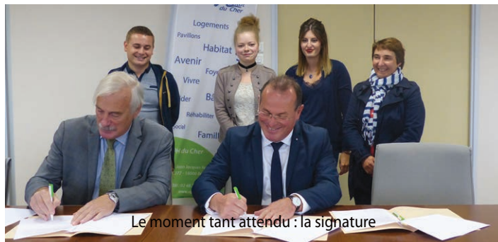
Le moment tant attendu : la signature

Preuve est de nouveau faite qu'avec de la motivation, de l'envie et une sérieuse volonté de se relancer, de se former, le jeune peut avec cette nouvelle acquisition de compétences trouver la voie de l'insertion professionnelle.