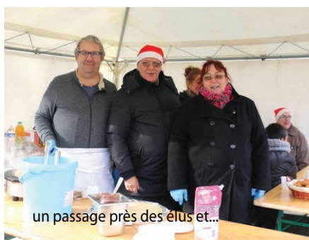
un passage près des élus et...