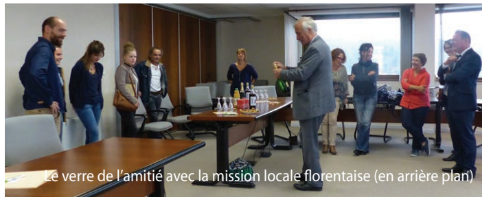
Le verre de l'amitié avec la mission locale florentaise (en arrière plan)