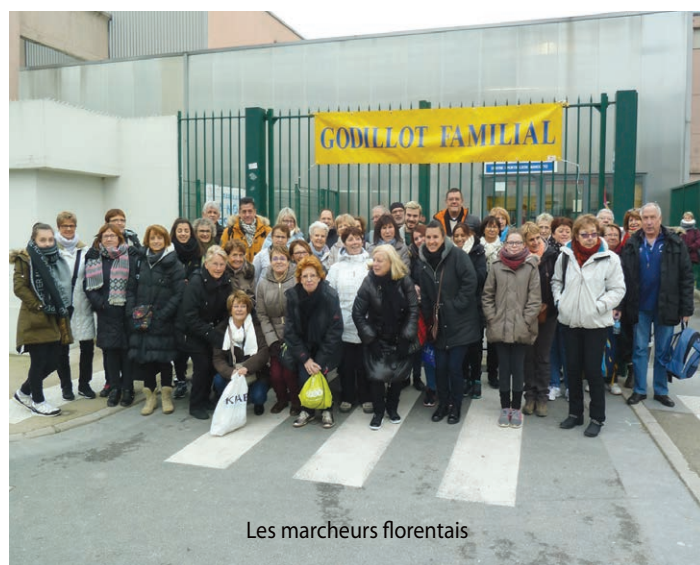
Les marcheurs florentais

Chemin faisant, les yeux émerveillés par la féerie d'avant Noël, les sportifs ont parcouru en moyenne une bonne quinzaine de kilomètres dans la capitale. Cette journée sportive était organisée par la Gym Vitalité de Saint-Florent-sur-Cher qui avait mis toute son énergie pour que cela soit une réussite. Paris tenu. Bravo.