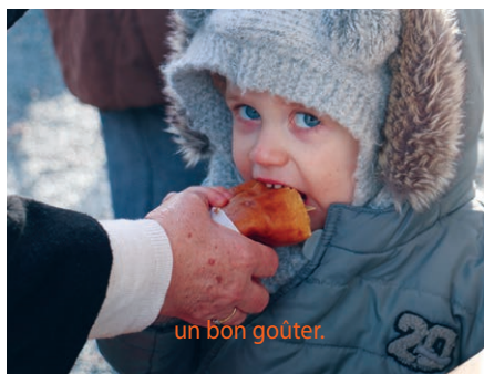
un bon goûter.