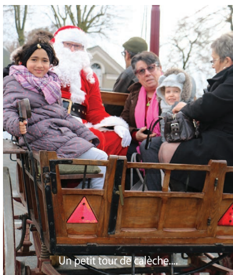
Un petit tour de calèche...

Les élus florentais étaient présents pour servir un bon chocolat chaud et préparer des crêpes pour ravitailler les enfants. Un bel après-midi qui a ravi petits et grands.