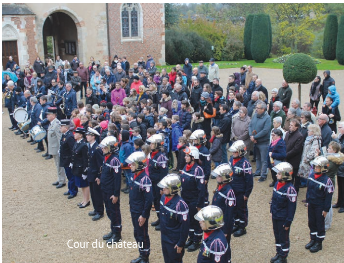
Cour du château

l'harmonie locale, de enfants des écoles et des habitants qu'était commémoré cet Armistice de 1918.