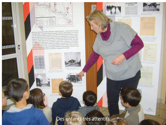
Des enfants très attentifs

Lundi 27 novembre, les enfants du service accueil de loisirs périscolaire étaient présents pour découvrir cette histoire. Ils ont appris que le Cher avait été coupé en deux de juin 1940 à mars 1943.