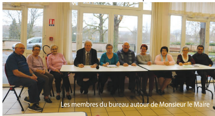
Les membres du bureau autour de Monsieur le Maire

Le club se réunit tous les 2 ÈMES et 4 È mardis de chaque mois.