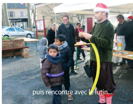
puis rencontre avec le lutin...