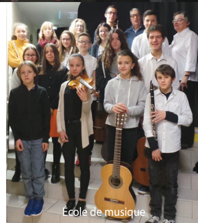
École de musique