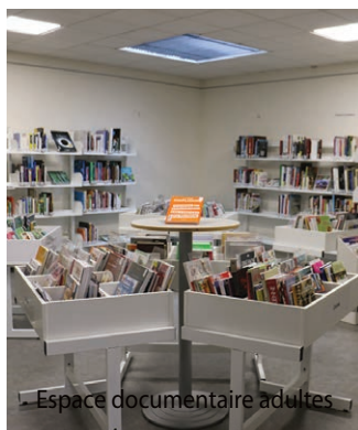
Espace documentaire adultes