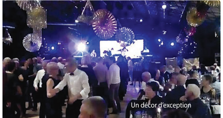
Un décor d'exception

Le président et son équipe tiennent à remercier l'ensemble des participants à ce réveillon qui leur ont envoyé des messages de sympathie dès la fin de soirée et les jours suivants.