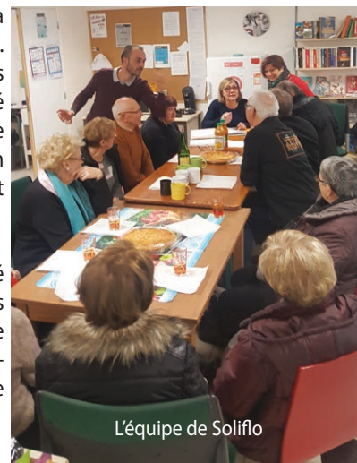
L'équipe de Soliflo

Différents ateliers ont été organisés avec l'aide des bénéficiaires sur la cuisine orientale et créole, pique-nique et une séance ciné-gouter avec le cinéma « LE RIO ».