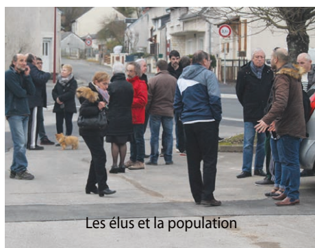
Les élus et la population

Après deux précédentes réunions dans les rues de la ville, c'était au tour des riverains de Salengro de rencontrer la municipalité.