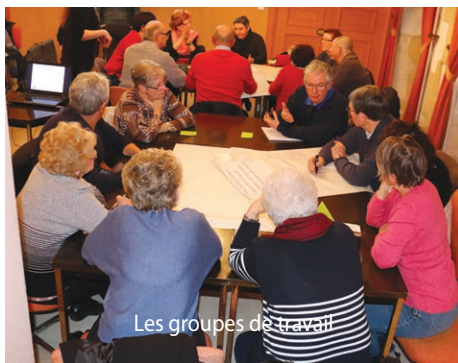
Les groupes de travail