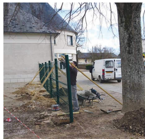
Mise en place d'une clôture à la maternelle Rive-Droite (conformité-sécurité)