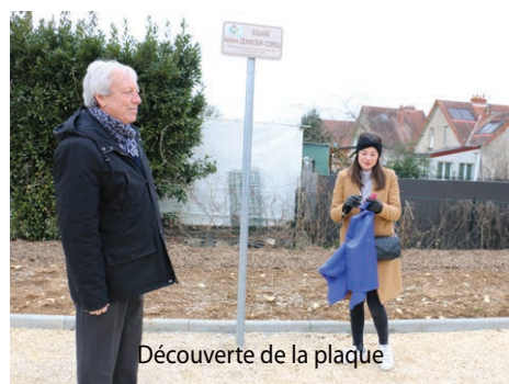
Découverte de la plaque