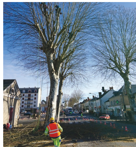
Campagne d'élagage des platanes par l'entreprise Daout, avec l'aide au sol des services espaces-verts et voirie de la ville.