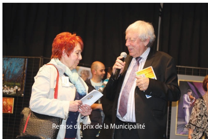
Remise du prix de la Municipalité

Vous pouvez découvrir où redécouvrir l'ambiance du salon sur le Facebook Groupe Artistique Florentais.