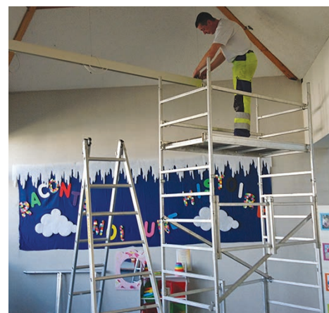
Changement de luminaires dans certaines pièces de la médiathèque.