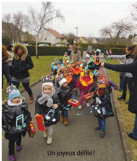
Un joyeux défilé!

Place ensuite aux déguisements pour défiler dans la cour de l'école en présence des familles lançant des serpentins. Ce petit moment festif s'est terminé par le partage d'un goûter confectionné par les élèves (crêpes et gâteau au yaourt). Les enfants ont illuminé le temps gris et glacial de leurs parures multicolores et fait briller les yeux de leurs parents.