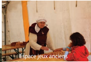
Espace jeux anciens