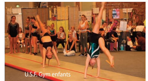
U.S.F. Gym enfants

culturel et des services techniques municipaux, et tout particulièrement au comité des fêtes de Saint-Florent-sur-Cher qui reversera le profit de sa buvette pour une action municipale.