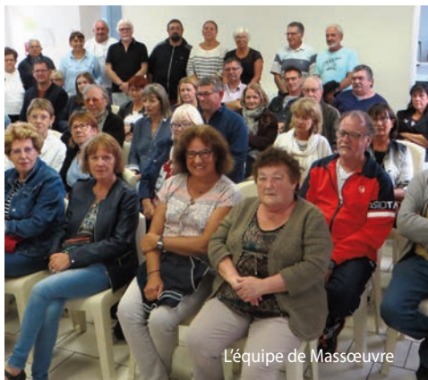
L'équipe de Massœuvre

Suite à l'assemblée générale du mois de septembre, l'association Massœuvre Animation fait un bilan plus que positif de cette année écoulée et a déjà lancé les idées de projet 2020 : beaujolais nouveau le 21 novembre, festival des Lanternes à Gaillac les 7 et 8 décembre, galette des Rois en janvier... et un voyage est à l'étude.