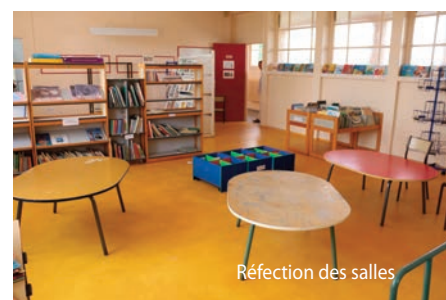
Réfection des salles