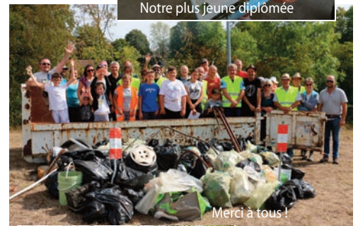
Merci à tous !