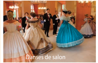
Danses de salon