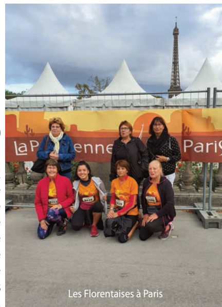
Les Florentaises à Paris

La Parisienne est une course à pied réservée aux femmes, organisée à Paris en septembre (généralement le 2 ème dimanche du mois) chaque année depuis 1997, sur une distance de l'ordre de 6,7 km. La Parisienne soutient la recherche médicale sur le cancer du sein. Depuis 2006, elle permet à la Fondation pour la recherche médicale de mettre en place des actions de collecte auprès des coureuses et des entreprises inscrites à la course.