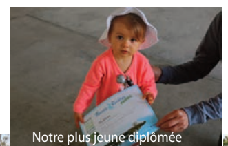
Notre plus jeune diplômée

La municipalité remercie tous les bénévoles présents, l'équipe dynamique des chasseurs à gibier d'eau, le SICTOM d'Issoudun, ainsi que les services municipaux qui ont contribué au succès de cette manifestation. Rendez-vous samedi 12 septembre 2020.