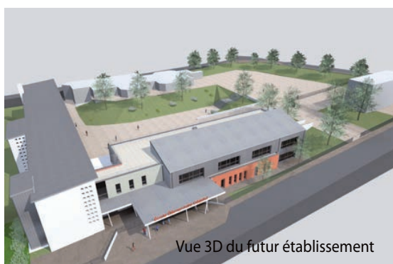
Vue 3D du futur établissement