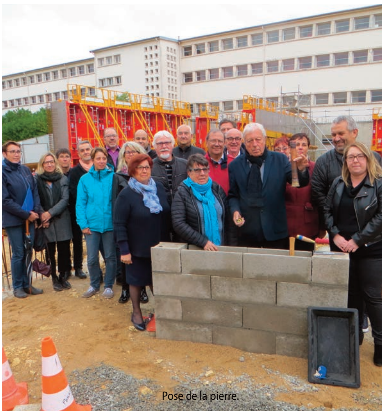
Pose de la pierre.