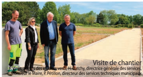
Visite de chantier

Des travaux budgétisés sur 2018 et 2019 pour un montant total de 116 648,57 €.