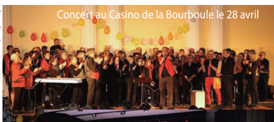
Concert au Casino de la Bourboule le 28 avril

Ce fut pour tous une belle expérience de partage et pour nous l'occasion d'un bel échange avec la chorale allemande Voices Unlimited. Langage universel, la musique, facilite, il est vrai, la communication. Un grand merci au comité de jumelage pour la qualité de son organisation et à la ville pour son soutien. Leurs actions conjuguées permettent de nourrir ces liens si essentiels de fraternité entre les peuples.