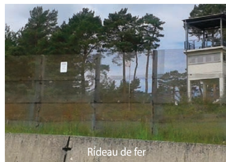
Rideau de fer

Réfléchissons ensemble, dès maintenant à la préparation de cette rencontre en lien avec le Comité de Jumelage. N'hésitez pas à les rejoindre. Toutes les idées et les bonnes volontés sont les