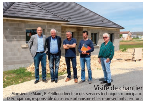
Visite de chantier

Le quartier du Bois d'Argent sort de terre... Quatre phases d'aménagement sont prévues pour ce chantier d'une ampleur importante. Alternant travaux et commercialisation, les travaux de voirie de la première phase sont d'ores et déjà achevés. Cette première partie de 13 hectares propose 28 lots à la vente, à ce jour 14 sont déjà réservés. Les premiers habitants poseront leurs valises dès septembre prochain.