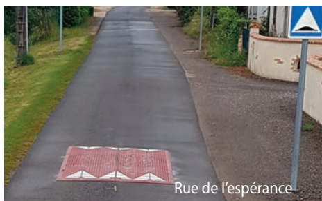
Rue de l'espérance

Installation d'un coussin Berlinois (dos d'âne) rue de l'Espérance à Champfrost afin de réduire la vitesse sur cette portion.