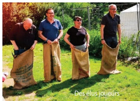
Des élus joueurs

La volonté de la municipalité de Saint-Florent-sur-Cher est, non seulement, de préserver les multiples échanges mis en place - depuis 1982 avec Neu Anspach et 2006 avec Sentjur - mais d'impulser et soutenir toute initiative en matière d'échanges sociaux, culturels, sportifs, scolaires, sans oublier la nécessaire convivialité basée sur les contacts humains entre habitants de nos 3 villes.