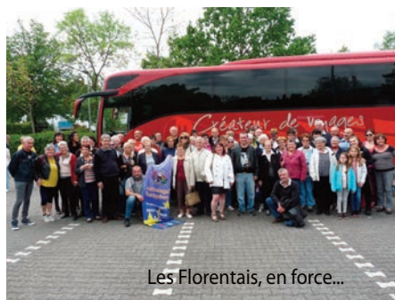
Les Florentais, en force...

Les aînés aussi étaient plus nombreux qu'à l'ordinaire, grâce à l'organisation d'un échange entre chorales. Plus de 45 choristes et conjoints de la chorale de Saint-Florent « Vicus Aureus » ont fait le déplacement. Accueillis par les choristes de la chorale allemande « Voices