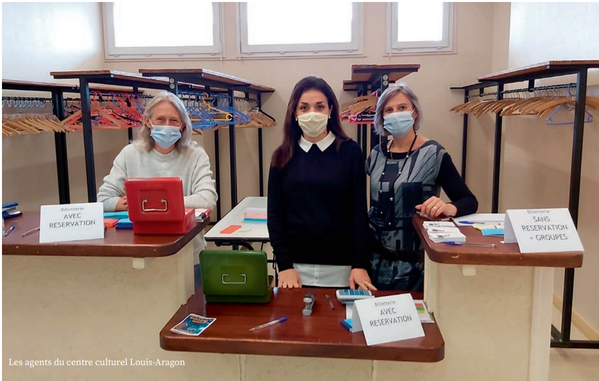
Les agents du centre culturel Louis-Aragon