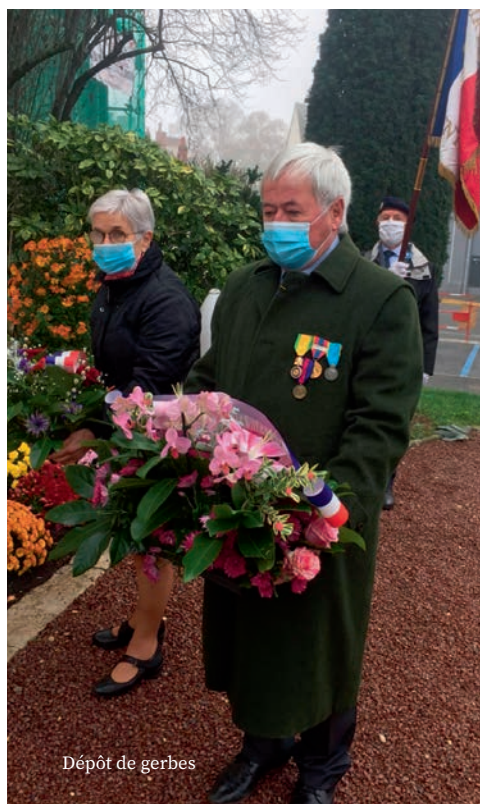
Dépôt de gerbes