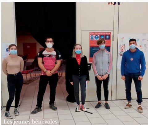
Les jeunes bénévoles