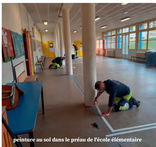
peinture au sol dans le préau de l'école élémentaire