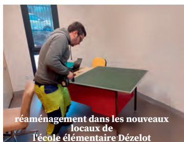
réaménagement dans les nouveaux locaux de l'école élémentaire Dézelot