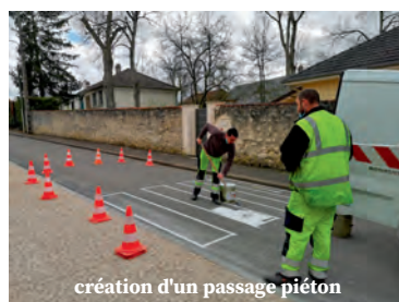
création d'un passage piéton