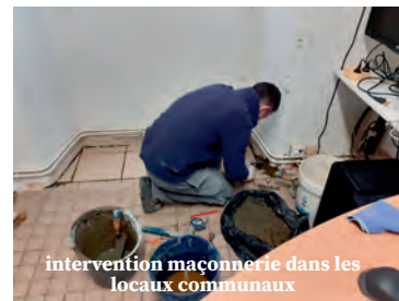
intervention maçonnerie dans les locaux communaux