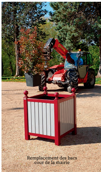
Remplacement des bacs cour de la mairie