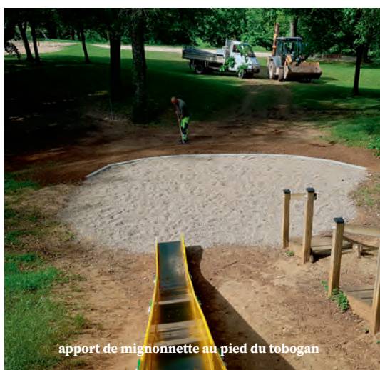
apport de mignonnette au pied du tobogan