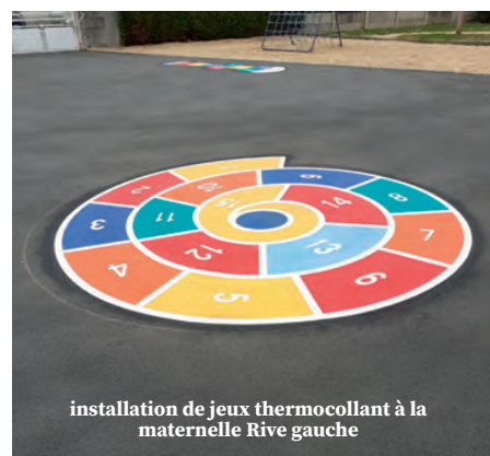
installation de jeux thermocollant à la maternelle Rive gauche