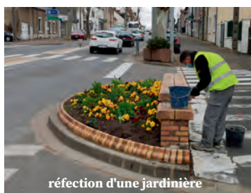
réfection d'une jardinière