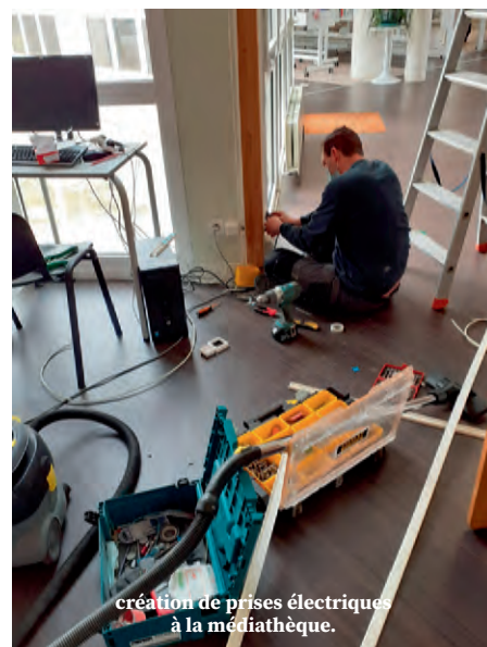
création de prises électriques à la médiathèque.