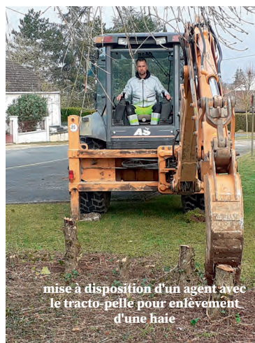
mise à disposition d'un agent avec le tracto-pelle pour enlèvement d'une haie

Ce service tente au mieux de répondre à toutes les attentes, celles des administrés, de la commune et doit pour ce faire, adapter en permanence un planning défini. Cela peut générer parfois un peu d'attente, mais le travail réalisé apporte toujours satisfaction.