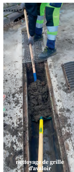
nettoyage de grille d'avaloir