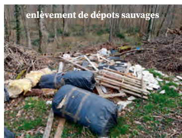
enlèvement de dépôts sauvages