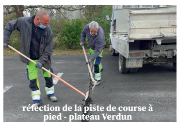
réfection de la piste de course à pied - plateau Verdun