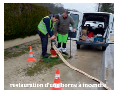
restauration d'une borne à incendie