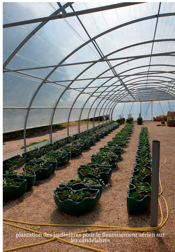
plantation des jardinières pour le fleurissement aérien sur les candélabres