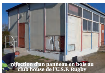
réfection d'un panneau en bois au club house de l'U.S.F. Rugby